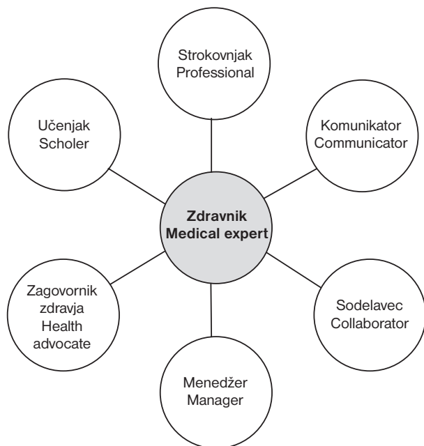
Sl. 2. Nova vloga zdravnika – okvir zdravnika (prirejeno po CanMEDS).